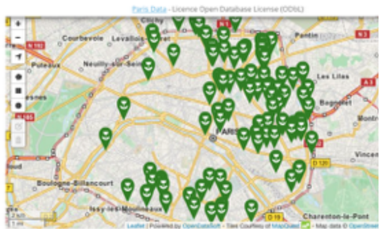
Cartographie des jardins partagés parisiens (mise à jour en cours)

L'onglet qui nous intéresse principalement, c'est celui consacré aux jardins partagés. La définition qu'en propose l'institution permet d'emblée de comprendre la conception qu'elle en a :